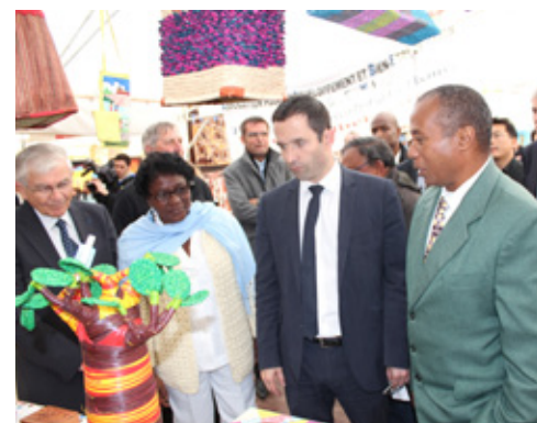
Sur le stand de Madagascar.

« Avec Stéphane Le Foll nous nous battons pour rétablir cette confiance, en France mais aussi en Europe, même si les bonnes intentions que nous avons notées immédiatement après le scandale de la viande de cheval doivent maintenant se transformer en décisions. Car, certains de nos partenaires européens ont un peu de mal à passer du discours à la pratique » a regretté le ministre.