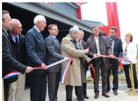
L'inauguration d'un lieu de Lumières.