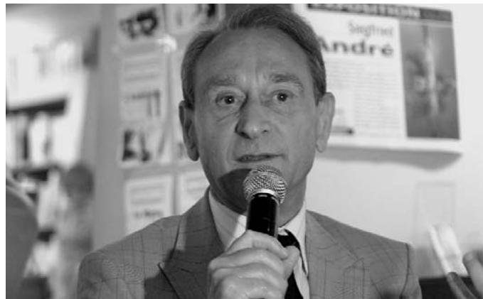
Bertrand Delanoë à la librairie Dialogue, à Brest le 7 juin 2008

La stratégie des alliances c'est le choix affirmé et sans ambiguïté d'un rassemblement à gauche et une volonté farouche de ne pas courir après une extrême-gauche qui, de toute façon, ne veut pas travailler avec nous, et un MoDem qui a comme unique objectif de nous remplacer.