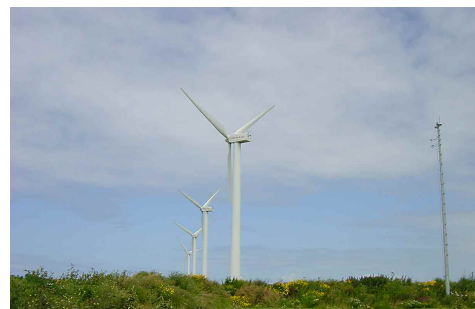
L'avenir passe par la "glaz économie"