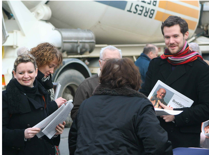
Jean-Yves Le Drian bénéficie d'un fort capital de sympathie