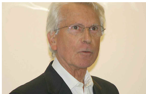
"Un domaine de compétences majeures"

Il définit les principes régissant l'organisation et la mise en œuvre des missions du Département pour la protection et l'autonomie des personnes, la cohésion sociale, l'exercice de la citoyenneté. Elles tendent à prévenir les exclusions et à en corriger les effets.