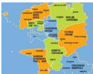
Les huit territoires d'action sociale

Le schéma 2010-2014 a été adopté à l'unanimité par le Conseil général. 🌹