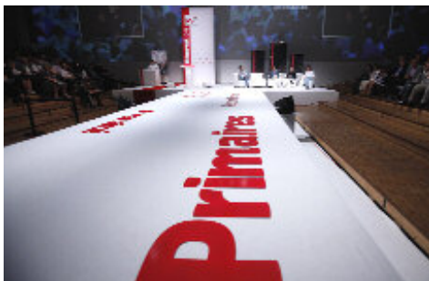
La rénovation est en marche !

Le volontarisme dont a fait preuve le Parti Socialiste le week-end dernier offre un contraste saisissant avec l'image que donne la majorité présidentielle. 🌹