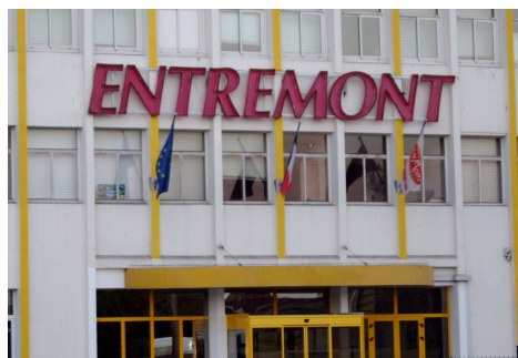
10 % des salariés dans le secteur du lait

Par le contrat, la profession s'engage à développer l'organisation et la structuration des ressources humaines, car les métiers de l'agroalimentaire sont encore trop souvent synonymes de précarité. Lié aux