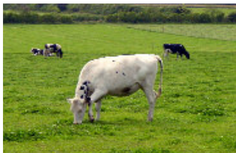
L'élevage prédomine en Bretagne

C'est ainsi qu'après plusieurs mois de travail, mobilisant plus de 80 personnes, le contrat de filière de l'industrie agroalimentaire a été signé, le 4 juin, par les principaux partenaires de ce secteur.