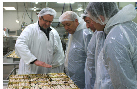
9 % des salariés travaillent les produits de la mer

récoltes agricoles, mais aussi aux demandes ponctuelles des consommateurs, ce secteur emploie beaucoup de salariés intérimaires. Cela peut représenter 10 000 équivalents temps pleins (ETP) en juillet ou 8 000 en janvier. En période creuse, de mars à juin, l'intérim représente 4 000 ETP.