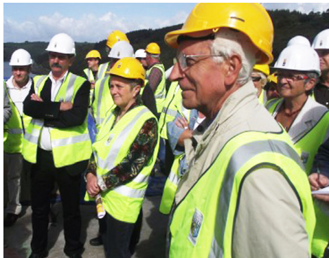
Précarité énergétique : des engagements en 2011

Le nombre de logements mis en chantier dans le Finistère est retombé au niveau du début des années 2000 et la superficie des parcelles vendues a tendance à baisser. Voilà ce qui ressort de l'étude 2010, réalisée pour l'Observatoire de l'habitat en Finistère, présentée par le président du Conseil général, Pierre Maille, et le préfet du Finistère, Pascal Mailhos, le 4 janvier à Quimper.