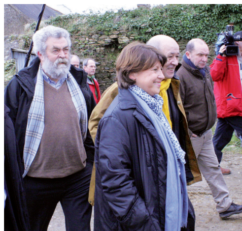
Le 14 février 2010, à Saint-Thégonnec

Dans le Finistère, ces forums se tiendront à Saint-Pol-de-Léon le 19 janvier, à Quimper le 16 février et à Carhaix le 25 février.