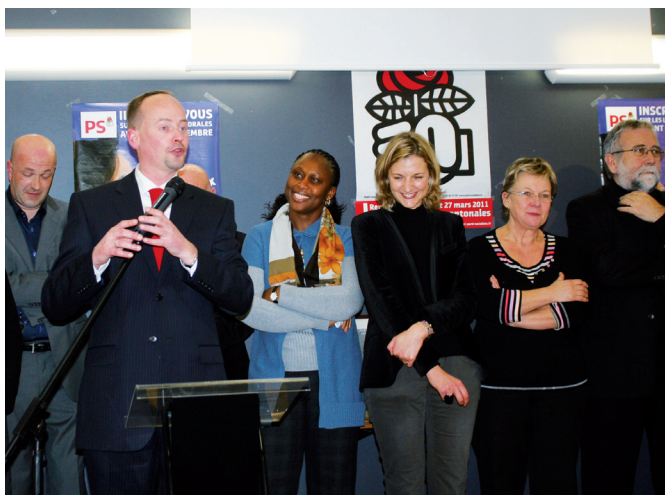
2011, année des cantonales, du projet et des Primaires