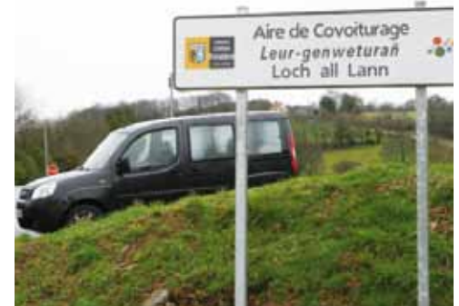
Soutenir le covoiturage

Depuis 1998, sous l'impulsion de Pierre Maille et de sa majorité, le Finistère a changé. Addition de 54 cantons auparavant, le Conseil général est devenu une instance vraiment départementale, qui définit ses objectifs, ses priorités, et discute avec ses partenaires sur un pied d'égalité.