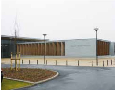
Le collège Nelson Mandela à Plabennec

Les 28 candidats de la majorité départementale ont, durant toute la campagne électorale, défendu les orientations du Manifeste pour le Finistère. Alors que leurs adversaires de droite, dans les cantons où ils se présentaient, multipliaient les « ya qu'à » et les « faut qu'on », en fonction de leur canton, ils défendaient une vision départementale, s'appuyant sur le bilan de la majorité sortante.