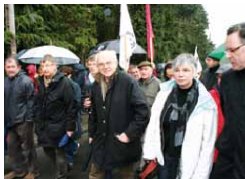
Les élus socialistes aux côtés des salariés