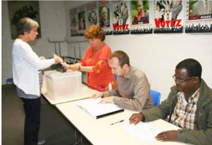
Une simulation de votes pour les Primaires