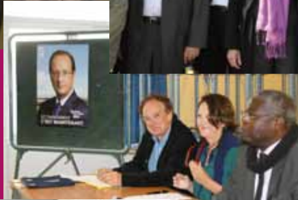
Brest, le 29 mars