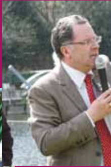
Port-Launay, le 20 avril