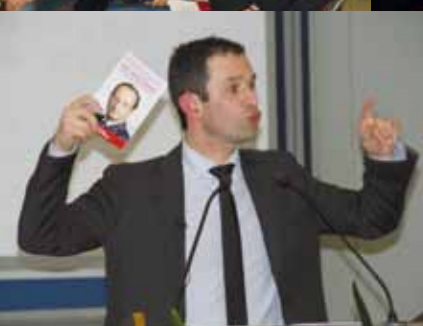
St-Renan, le 21 mars