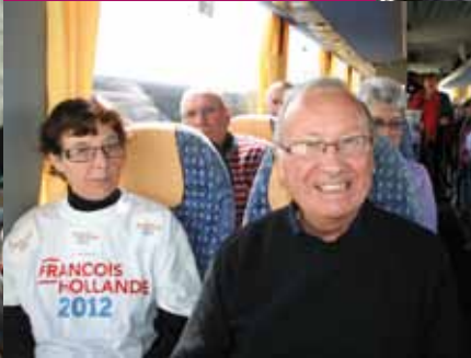
Rennes, le 4 avril