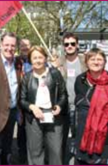
le 3 mars