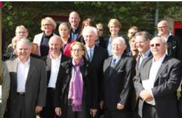
Châteaulin, le 31 mars