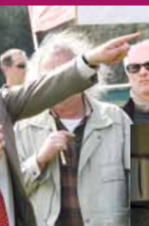
Le Relecq-Kerhuon, le 17 avril