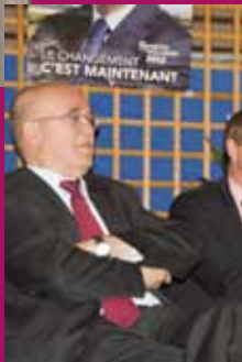
Quimper, le 1 er avril