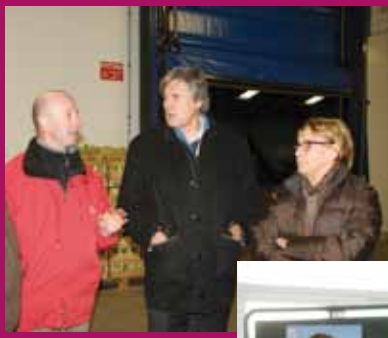
Santec, le 10 février