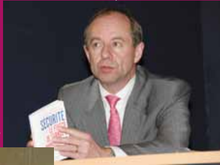
Bellevue, le 27 mars