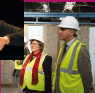
Landivisiau, le 1er mars