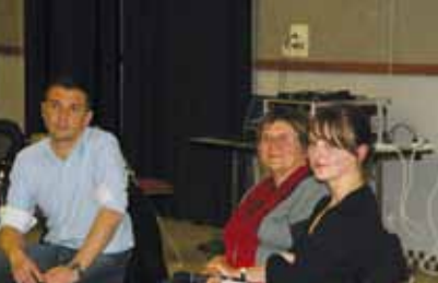
Brest, le 4 janvier