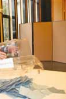
le 22 avril