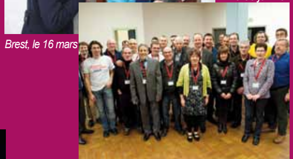
Brest, le 16 mars