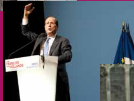
Brest, le 30 janvier