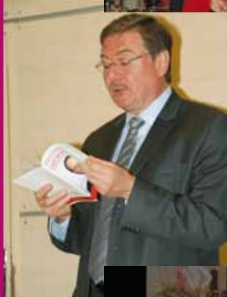
Landerneau, le 2 avril