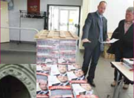
Tracts du second tour