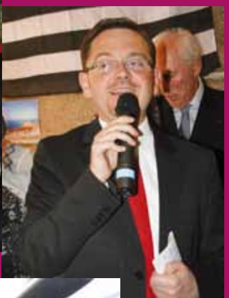
Moëlan-sur-Mer, le 20 avril