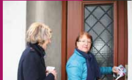
Service d'ordre, le 30 janvier