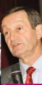
Pont-l'Abbé, le 2 mars