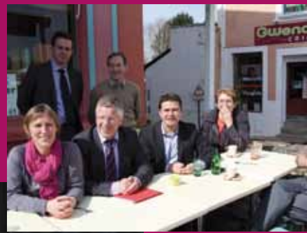
Quimperlé, le 1 er avril