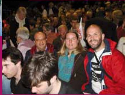
Rennes, le 4 avril