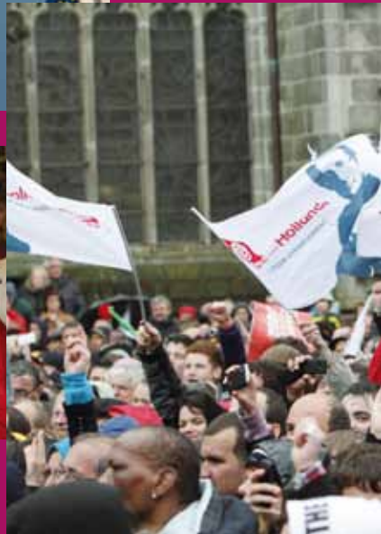
Quimper, le 23 avril