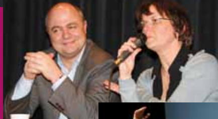
Douarnenez, le 16 mars