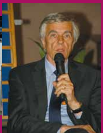
Quimper, le 10 avril