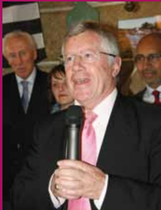
Moëlan-sur-Mer, le 20 avril