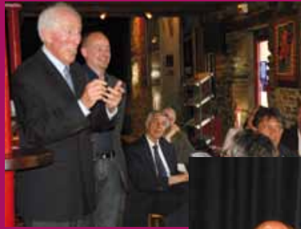
Châteaulin, le 31 mars