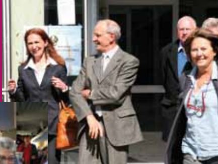
Brest, le 26 mars