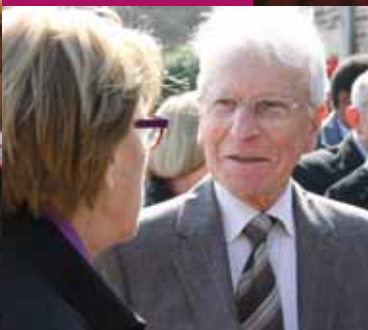
Châteaulin, le 31 mars