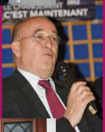
Quimper, le 10 avril