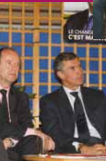
le 10 avril