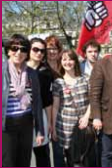
Quimper, le 1 er avril