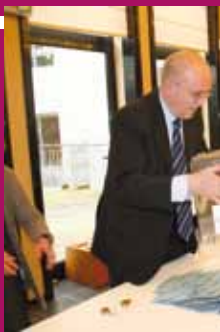
Quimper, le 1 er avril