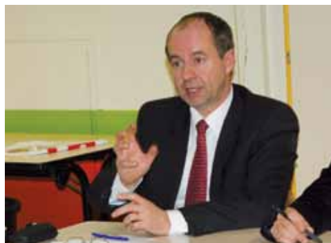
« Un avis consultatif »

Dans un courrier adressé au premier ministre, une quinzaine de parlementaires socialistes bretons ont rappelé que « les langues et les cultures de France ne constituent pas un repli sur soi mais représentent bien des moyens d'ouverture sur nos voisins européens. Il nous faut envisager ces langues comme un trésor, une richesse ancrée dans nos territoires, attachés à leurs racines mais aussi à la République ».