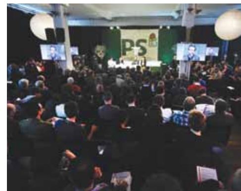
Le premier forum après le congrès de Toulouse

Pour le Premier secrétaire national la fiscalité écologique doit répondre à trois conditions. Tout d'abord, l'attribution principale des recettes de la fiscalité écologique doit aller à la transition écologique.