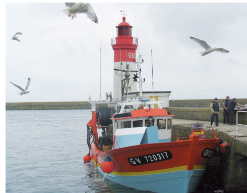
Le secteur de la pêche dans l'incertitude

De plus, le Royaume Uni est le 3 e investisseur étranger en Bretagne. Avec 50 entreprises, cela représente 3 700 emplois.