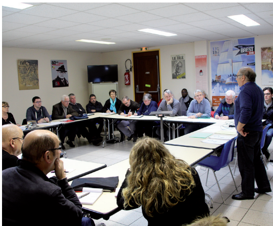
Formation des présidents de bureaux de vote

Après avoir pris les bulletins, l'électeur se rend dans l'isoloir et vote pour l'un des sept candidat.es. Muni du coupon indiquant son numéro d'ordre, l'électeur se présente devant le président du bureau qui vérifie sa pièce d'identité.