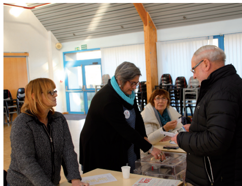
36 755 électeurs dans le Finistère

Dimanche, les électeurs de gauche se sont exprimés pour choisir le candidat qui les représentera à l'élection présidentielle. Ce bel exercice démocratique a été possible grâce à la mobilisation de centaines de bénévoles. Mais leur mobilisation ne s'est pas limitée à la tenue des bureaux de vote de 9h00 à 19h00.