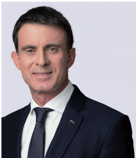
Benoît Hamon et Manuel Valls arrivés en tête au soir du premier tour

Les Primaires, initiées en France par le Parti Socialiste en 2011, sont désormais inscrites dans le paysage politique français.