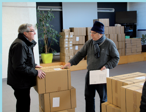
La réception des kits électoraux

Dimanche, le même exercice démocratique se renouvellera pour départager les deux finalistes et désigner le candidat de la Belle Alliance Populaire à la Présidentielle.