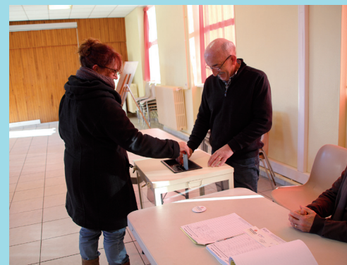
Les électeurs s'expriment