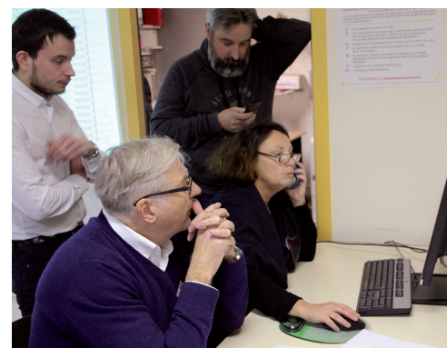
La Haute autorité valide les résultats