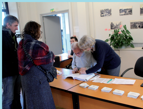
Vérification de la liste d'émergence