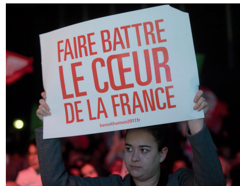
Pour un grand rassemblement populaire

notes d'expertise et seront alimentés par les témoignages d'experts, juristes, économistes, entrepreneurs, acteurs de la société civile, etc. Cela devra aboutir à l'élaboration de propositions concrètes pour le programme sur neuf thématiques.