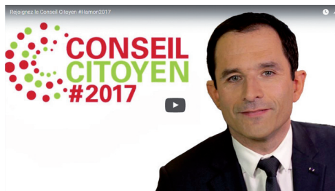
Une demande participative

« Le projet présidentiel que nous proposons ne repose pas sur la croyance en l'homme providentiel », répète depuis le début de sa campagne Benoît Hamon. « Notre démarche est nourrie par les échanges, les rencontres et l'expertise citoyenne. Cette réflexion se poursuit encore aujourd'hui pour aboutir à d'autres propositions. »