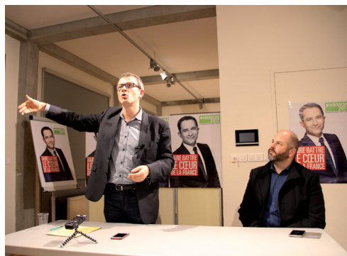
Nous allons procéder par étapes