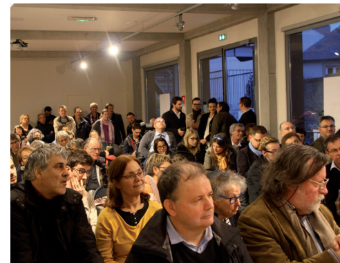
Un public attentif

La deuxième phase interviendra ensuite après une longue période de négociation qui réunira les syndicats de salariés, d'employeurs, mais aussi l'État, les ONG et les associations et collectivités locales, ce qui n'a jamais été engagé depuis la Libération.