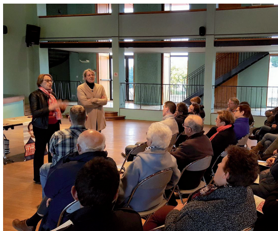
Réunion publique à Plougonven