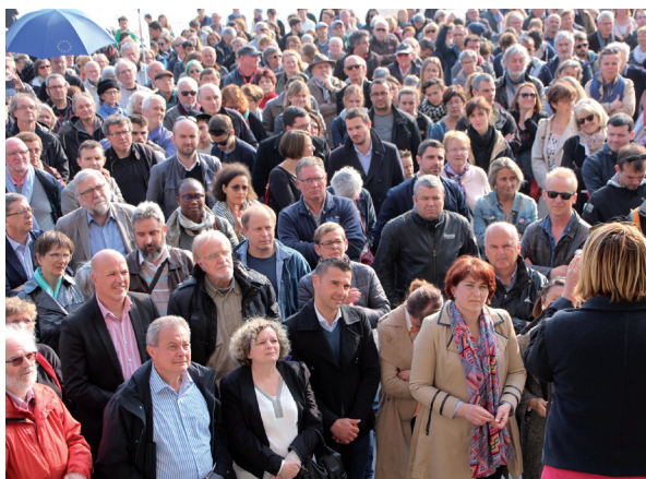
Contre l'Extrême-droite !

Plus loin, elle explique : « On nous rebat les oreilles avec la Shoah. Il y a un deux poids deux mesures avec le génocide vendéen par exemple, alors qu'on passe son temps à nous culpabiliser avec la Shoah. Ça génère un antisémitisme qui n'est pas méchant. Je connais plein de gens bien qui n'aiment pas particulièrement les Juifs ».