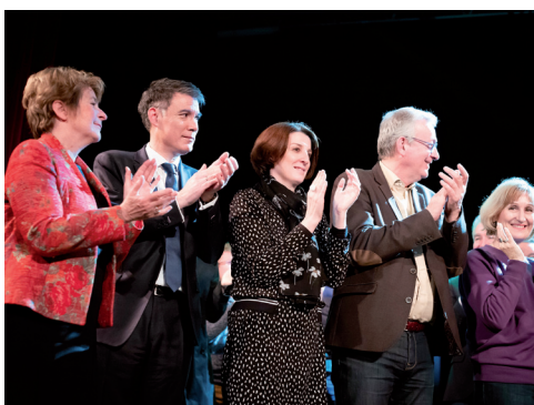
Olivier Faure à Besançon, le 4 mars

Mais ce scrutin ne doit pas être qu'une sanction. Il doit aussi être un vote d'espoir pour la gauche. Partout, les socialistes ont privilégié son union. Elle ne s'est pas réalisée partout. Mais elle reste l'objectif prioritaire, car elle seule permettra de faire émerger une alternative au face-à-face mortifère entre les libéraux