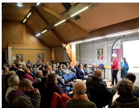
Pour des transports doux à Quimper

S'il y a bien un enseignement à tirer des débats des Municipales, c'est que le clivage gauche/droite est encore puissant. Il suffit pour s'en convaincre de regarder le bilan des équipes sortantes à Morlaix, Douarnenez ou Quimper, ou les arguments des listes d'opposition à Brest ou Plouzané.