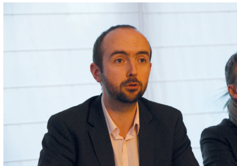
Nous restons en permanence à l'écoute

Avant même l'ouverture des bureaux de vote, on connaît déjà les résultats des élections municipales dans 64 communes de plus de 1 000 habitants dans le Finistère où une seule liste s'est déclarée.