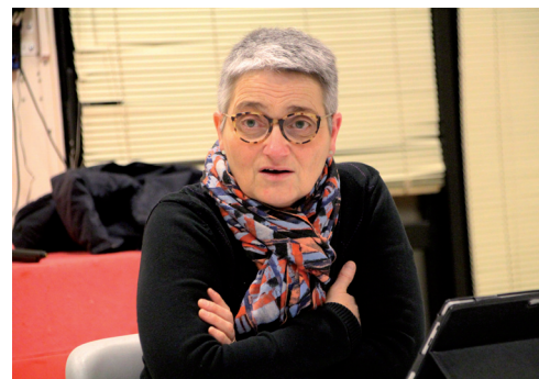
En campagne pour le respect des électeurs