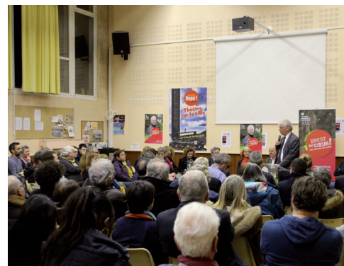
Brest se dotera d'une COP26

La plateforme programmatique du PS propose d'instaurer des COP26 territoriales de manière à associer et entraîner l'ensemble des forces vives à prendre des mesures concrètes pour limiter leur empreinte carbone. Elle propose également d'organiser, chaque année, un débat d'orientation écologique à l'image des débats d'orientation budgétaire.