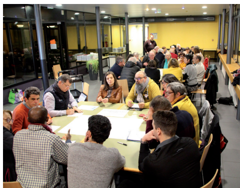
Atelier démocratie à Morlaix

« La lutte contre la délinquance doit rester une prérogative de l'État », rappelle, à chacune de ses réunions publiques, François Cuillandre. « Les collectivités locales, cependant, ont un rôle à jouer en matière de prévention et de soutien à la police, notamment en lui offrant des locaux adaptés à ses missions. »