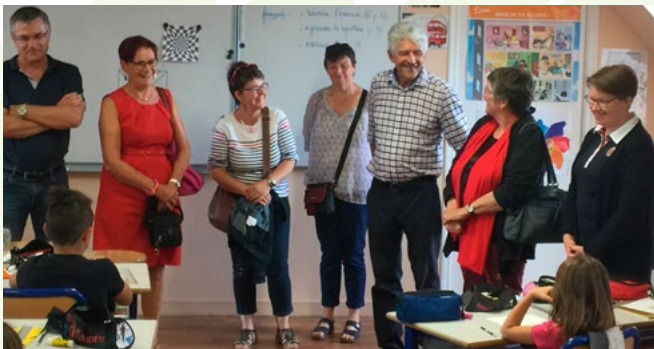
■ Ecole de Plounevez-Lochrist

Lors de la rentrée scolaire, avec les maires j'ai rendu visite aux écoles primaires de PLOUIDER, LA FOREST-LANDERNEAU, LE RELECQ-KERHUON, LESNEVEN, SAINT MEEN, PLOUGOURVEST, LAMPAUL-GUIMILIAU et PLOUNEVEZ-LOCHRIST.