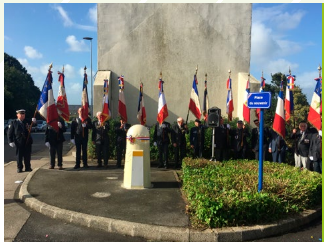
■ Inauguration au Relecq-Kerhuon