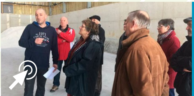
■ A Saint-Méen

Avec les équipes municipales de Saint-Méen, puis du Folgoët, j'ai rencontré différents acteurs économiques du territoire et les habitants au cours du traditionnel café citoyen.