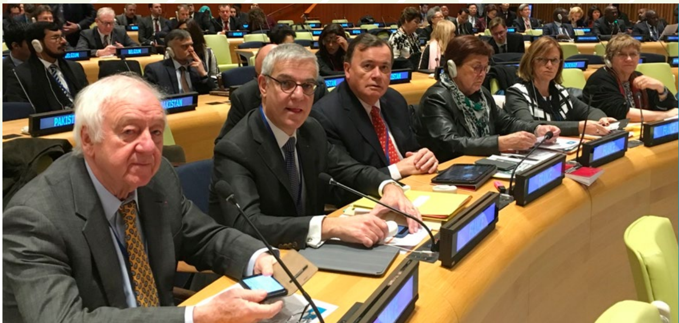
■ à l'ONU sur le thème du monde bleu avec 200 parlementaires du monde entier

J'ai pu mettre en avant la nécessité de travailler sur un statut juridique des ressources génétiques des fonds marins. Tant que les ressources de la biodiversité seront en libre accès, il ne sera pas possible de pérenniser les ressources génétiques marines. Un statut d'intérêt commun existe dans la convention sur le climat, adapté aux ressources marines vivantes, il permettrait d'avoir un statut d'exploitation soutenable des océans.