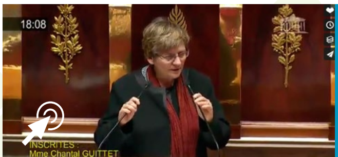
■ Mon intervention sur l'obligation d'avoir un casier judiciaire vierge pour les candidats