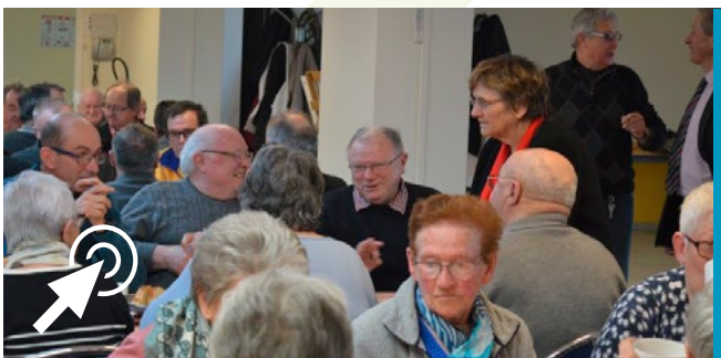
■ Au Folgoët