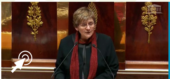
■ Mon intervention sur les modalités de dépôt des candidatures

Je continue d'auditionner, en vue de la rédaction de mon rapport sur les violences spécifiques que subissent les femmes migrantes. J'ai auditionné :