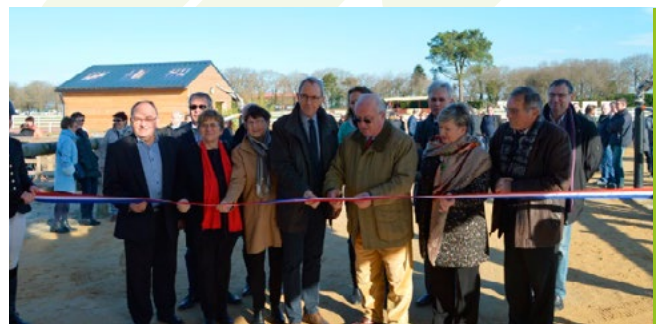
■ A l'inauguration de L'Equipôle, à Landivisiau