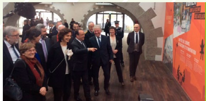
■ Lors de la venue de François Hollande et Audrey Azoulay, à Brest