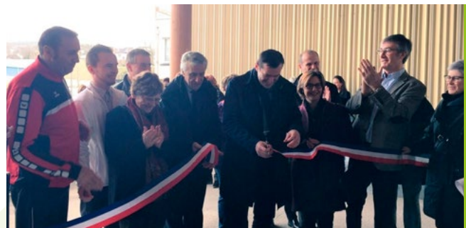
■ Lors de l'inauguration de La Fabrik, à Landerneau