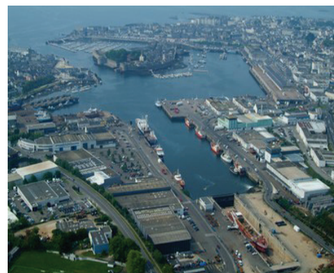
Accompagner le développement du port de Concarneau